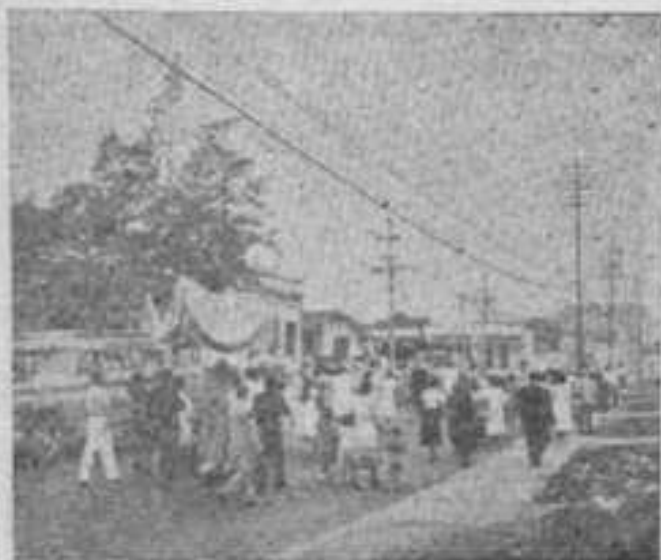
A procissão de N. S. Menina, na rua Leopoldina Rêgo. Penha, Distrito Federal.

A meia noite de Natal e Ano Bom, foi celebrada a missa, na Penha, com grande concorrência de povo.