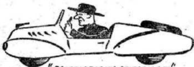
"PROPRIETARIOS DE CADILACS"