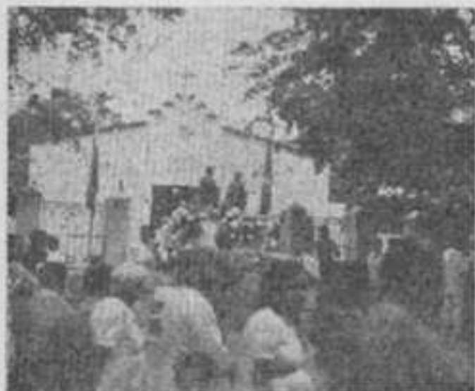
A procissão do N. S. Menina, na Penha, Distrito Federal, movimentava-se.