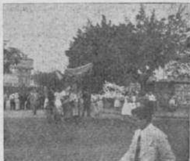
Procissão de N. S. Menina, dobrando a esquina da rua do Couto.

Romana não tem propriedade dessas Vestes, que foram plagiadas de outros Ritos. Portanto, a Igreja Romana, pelos seus Cardiais, não tinha direito de