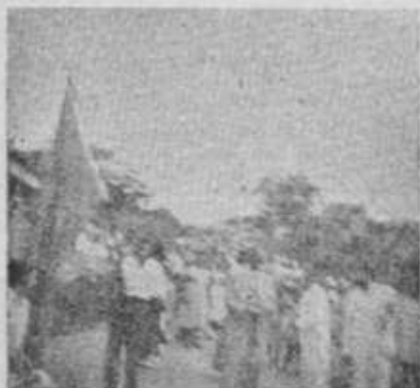
A procissão do glorioso Mártir S. Sebastião, atravessando as ruas de S. Mateus, no Estado do Rio de Janeiro.