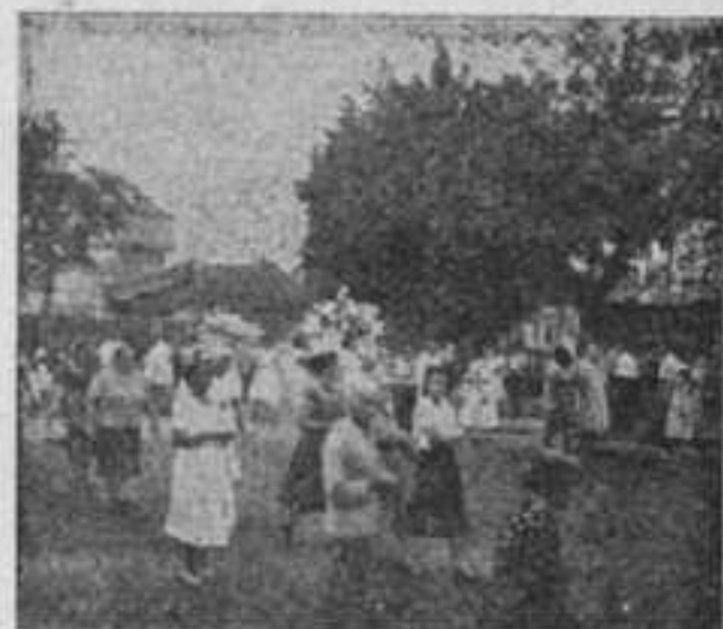
A procissão de N. S. Menina, no I.A.P.I., da Penha, Distrito Federal.

Sabe V. Ex., Sr. Deputado, que essa palavra NACIONALIZAÇÃO não soa bem, nos ouvidos dos apátridas. Exploram o povo brasileiro com