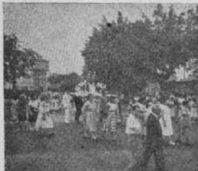
Procissão de N. S. Menina, na Penha, Distrito Federal.

Não somente a nossa Carta Magna não reconhece o Papa como Chefe Universal de todos os "Credos Religiosos", como veda, à União, aos Estados, ao Distrito Federal e aos Municípios, "ter relação de aliança ou dependência com qualquer culto ou Igreja", num regime de separação da Igreja do Estado.