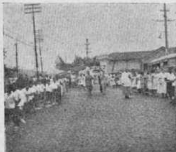
Proceissão de N. S. Menina, na Penha, Distrito Federal — Na foto, a Escola N. S. Menina.

far relevantes serviços á Humanidade. E' coza pruzer que, ao completar nove annos, "LUTA!" assim se externa aos brasileiros. Diante do altar de Deus, estivemos todos unidos, em ação de graças, comemorando, festivamente, o nono aniversário da fundação da ICAB, ato que se realizou, no domingo, 11 de julho, por ter caído 6, em dia de semana. A