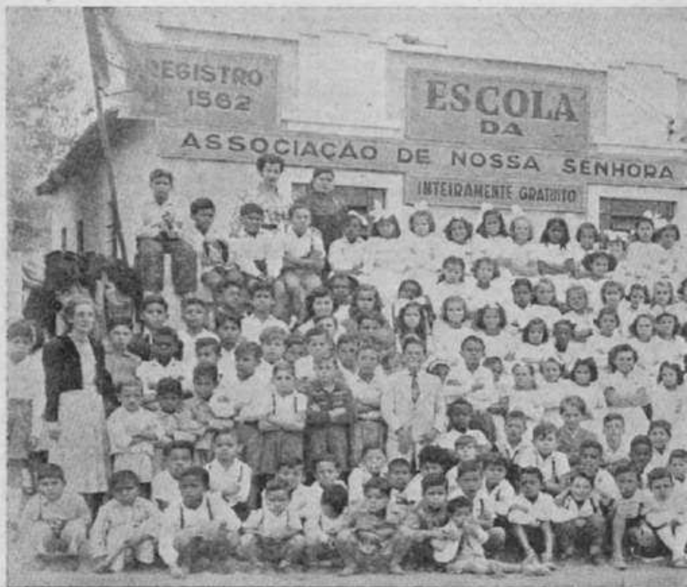
— Escola N. S. Men