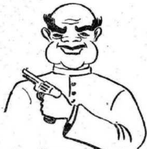
"PORTE DE ARMAS"