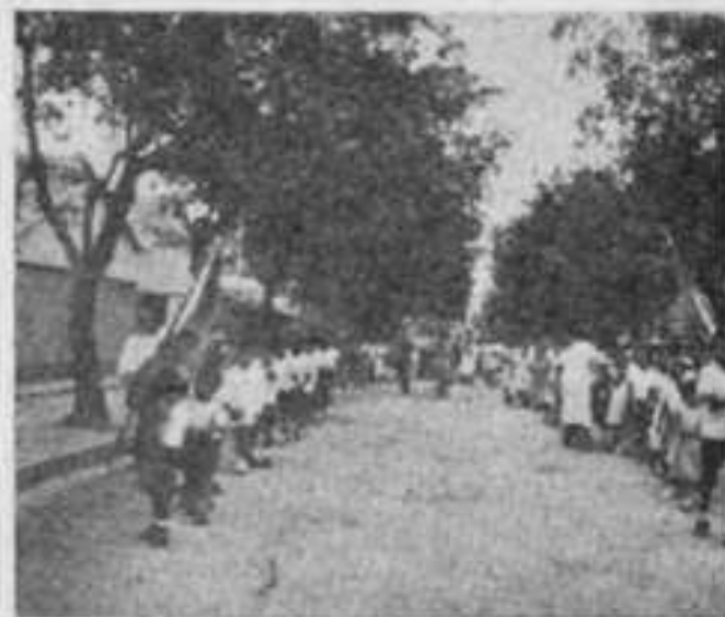
Proceissão de N. S. Menina — na Penha — Na foto, a Escola N. S. Menina.