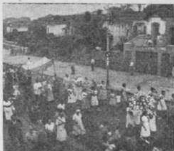
O ador de N. S. Menina, carregado por genís senhorinhas.