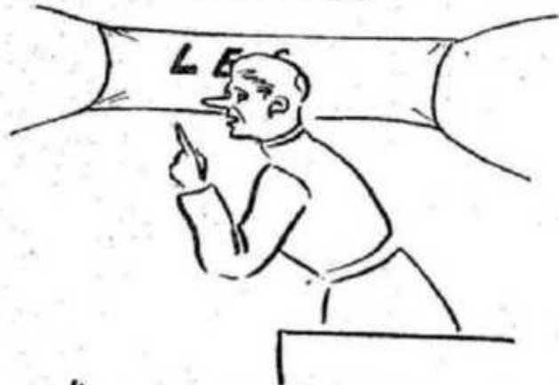
"MANIFESTAR-SE SOBRE POLITICA"

Esquecem-se, ainda, os Cardiais que uma ação é sempre acompanhada de uma reação. E a reação será tremenda!