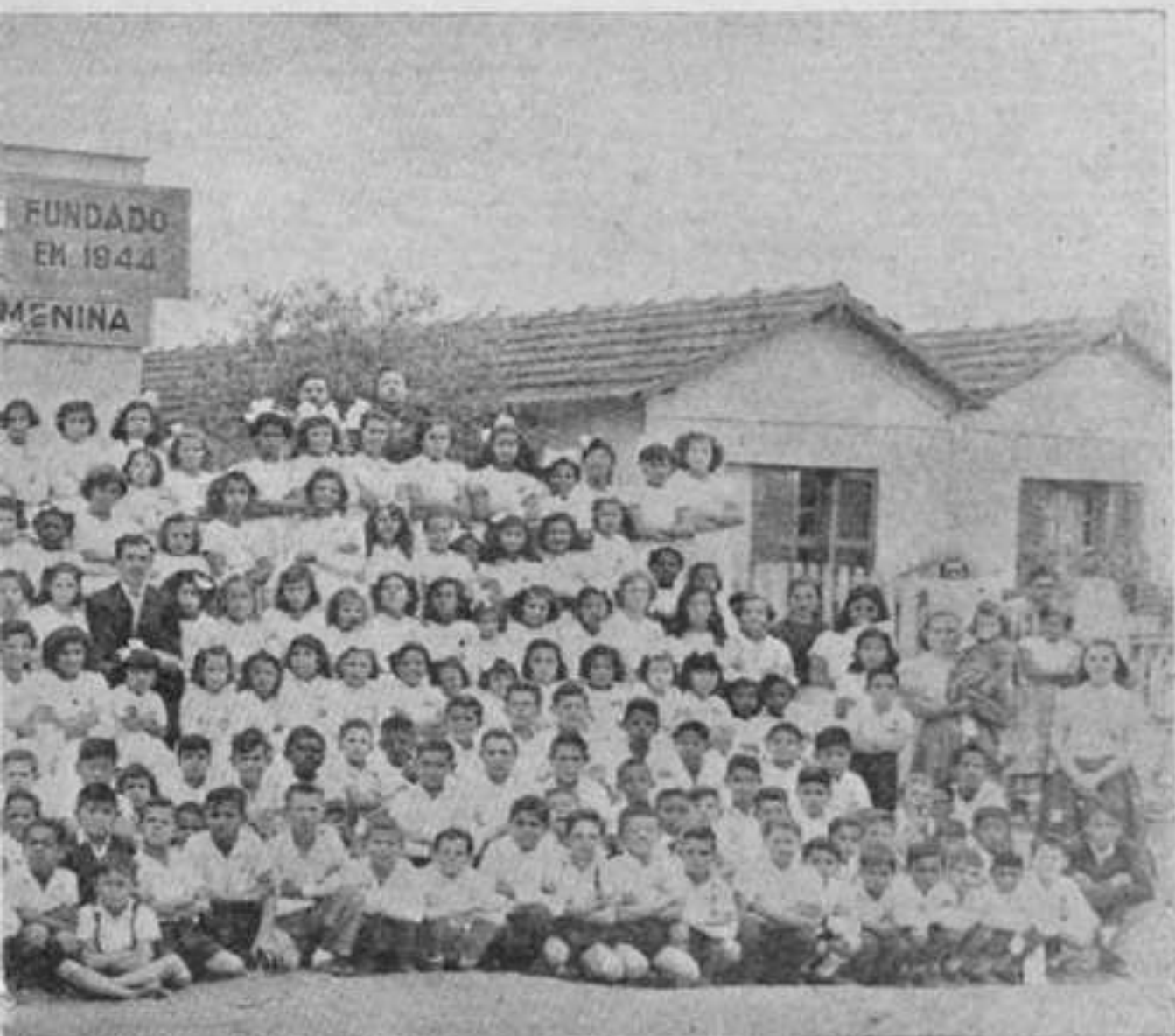
na — São Paulo —

Episcopado Romano, o Clero, em geral; de outro lado, estão os entreguistas, aqueles que estão sendo comprados pelo Dólar Americano. Esta a luta aberta. Conosco está o povo, em geral. Do outro lado, o Capitalismo religioso e não religioso. As nossas armas são: O sacrifício, baseado no IDEAL. As armas inimigas são: Metralhadoras, Bombas Atômicas e etc. Nós estamos certos da Vitória, e inímito, certo da Derrota. A luta parece desigual, mas não é. A nossa constância, a nossa perseverança, a nossa fome constituem o baluarte da nossa Fortaleza, que é a Pátria querida. Passados nove anos, está a ICAB conhecida, em todo o território nacional. Nestes nove anos, fraca-