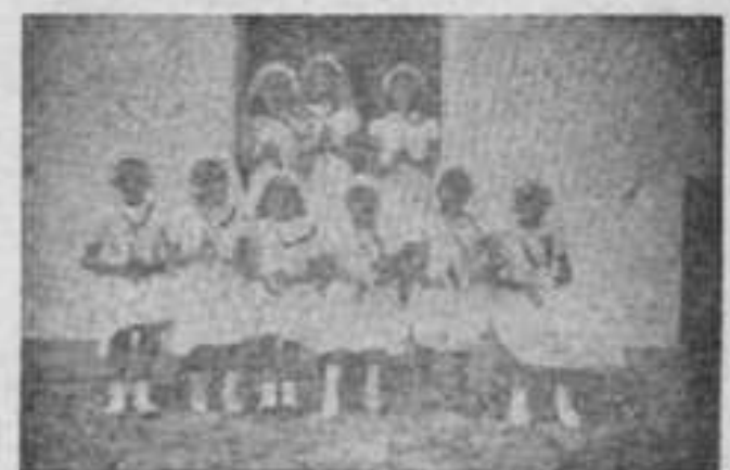
Em Barra de S. João, crianças que fizeram a primeira comunhão.