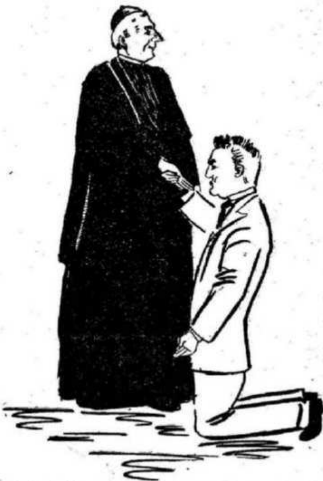
O Prof. Lucas Nogueira Garcez, Governador de S. Paulo, prostra-se diante do Cardial Legado e pede, reverentemente, a bênção!...

Luz e força, isto é, light and power , são privilégios e monopólios de companhias estrangeiras! Quem sabe, no Brasil, o que significa light and power ?