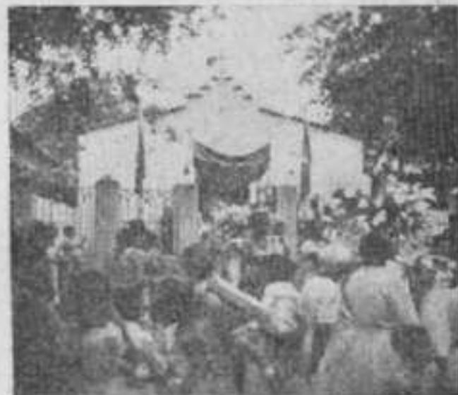
Os gloriosos Mártires Cozme e Damião, patronos da ICAR, saindo da Igreja abençoam o povo carioca, na procissão de N. S. Menina.

5) Sendo toda capacidade de trabalho, como todo instrumento de trabalho, um capital acumulado, uma propriedade coletiva, a desigualdade de vencimentos e de fortuna, sob o pretexto de desigualdade de capacidade, é injustiça e roubo.