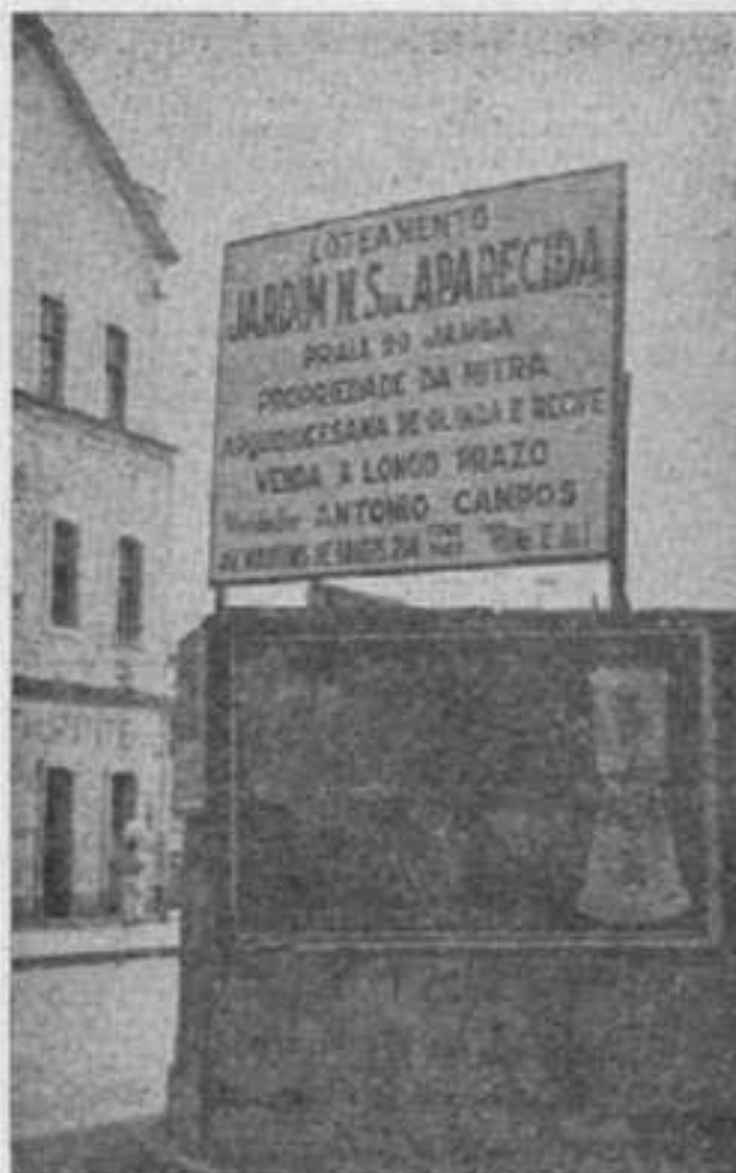
Presidente dessa arapuzia é o Arcebispo de Olinda e Recife, Dom Antônio de Almeida Moraes Junior

O sítio N.S. do Amparo foi comprado em 13 de maio de 1953 (Doc. 2). O seu loteamento mereceu a aprovação em 21 de maio de 1953 (Doc. 3 e 4). O último edital foi publicado em 12 de junho de 1953 (Doc. 5). A primeira venda só poderia, por lei, ser realizada a partir de 22 de julho de 1953. Mas, apesar