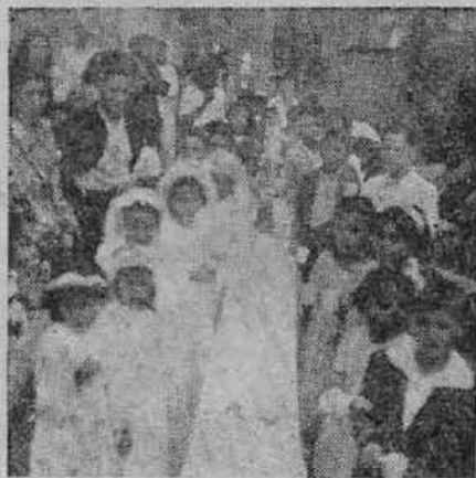
Primeira comunhão em Lages S. C.

?E as florescentes Igrejas Cristãs, fundadas paulatinamente por toda a Palestina, Asia Menor etc., antes, muito antes, da fundação da Igreja de Roma, eram tais Igrejas, papistas ou romanas? E essas referidas Igrejas, primitivamente Cristãs e Apostólicas, sem "papa romano", sem Vaticano, sem Guarda-Pontifícia, sem Colégio Cardinalício, sem Bandeira temporal, sem Polí-