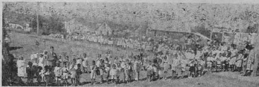
Procissão votiva de Natal, realizada em Lages, S. C. em 25-12-47

?A Igreja Apostólica primitiva, reunida em companhia da Virgem Mãe, no Cenáculo, em Jerusalém, capital da Judea, ao dia de Pentecostes, quando recebeu o Espírito Santo, para que também falasse todas as línguas inclusive a língua do futuro Povo Brasileiro, aquela Igreja, repetimos, era verdadeira ou não? Era, respondeis, por certo. Entretanto, aquela Igreja Santíssima, assistida visivelmente pelo próprio Espírito de Deus, NÃO ERA romana.