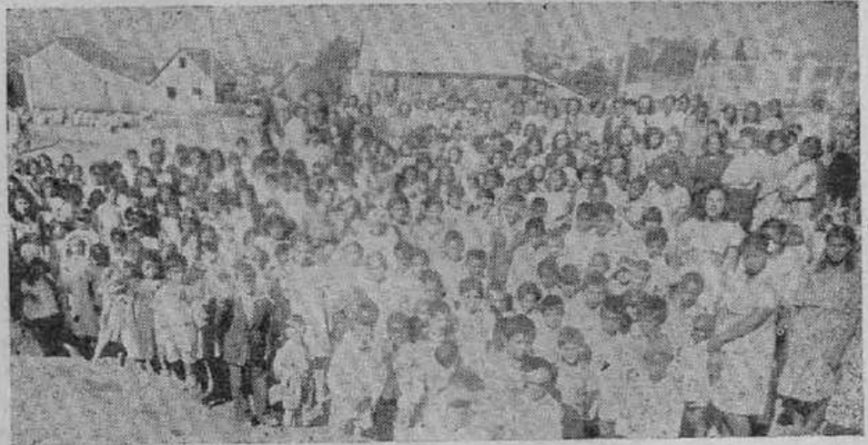
Aspecto da Juventude católica Brasileira de Lages, S. C. a grupada em redor do seu Bispo Diocesano por ocasião das Festas de Natal